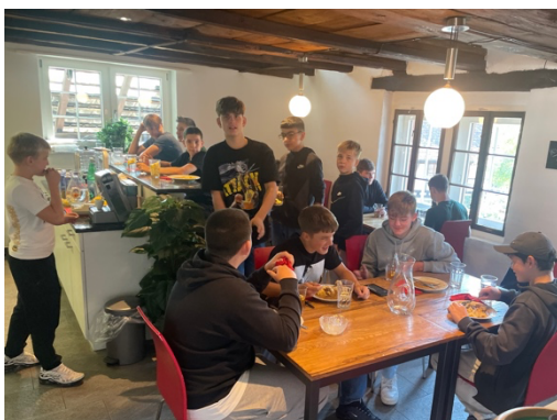
Mittagessen im AMBOSS

Das Angebot, am Donnerstag zum Mittagessen zu kommen und die Mittagszeit im Jugendtreff zu verbringen, ist ein fester Bestandteil des Angebotes geworden. Bei diesen Treffen geht es oftmals laut, schrill und auch mal chaotisch zu und her. Eben genau so wie es sein sollte. Gleichzeitig sind die Jugendlichen sowie die jungen Erwachsenen, welche sporadisch über Mittag auftauchen, sehr hilfsbereit, wenn es darum geht zu servieren oder abzuräumen. Es wird Wert auf richtig Begrüssen und Verabschieden gelegt und oftmals bedanken sich die Teilnehmenden für das Essen. Es ist der Jugendarbeit ein Anliegen, den Jugendlichen nicht Pommes und Nuggets vorzusetzen, sondern ihnen durch dieses Angebot die Möglichkeit zu geben, neue Lebensmittel kennen zu lernen.