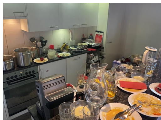
Nach dem Sturm...